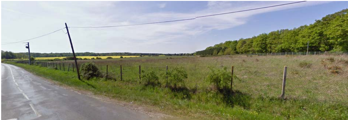
Vue depuis la RD73

L'objet de cette OAP est de cadrer l'aménagement de ce secteur, entouré de boisements et cultures agricoles.